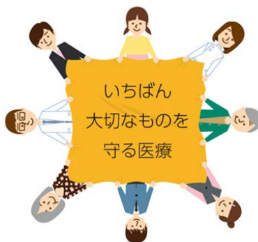
※チーム医療推進協議会HP

一人の患者さんに、複数のメディカルスタッフ（医療専門職）が連携して、治療やケアに当たります。薬剤のスペシャリストはその重要なメンバーです。