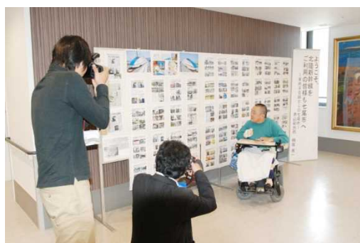
昨年「恵寿総合病院」3階で展示