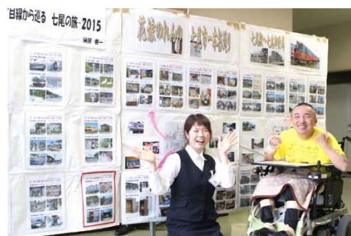
今年「青山彩光苑」正面玄関で展示