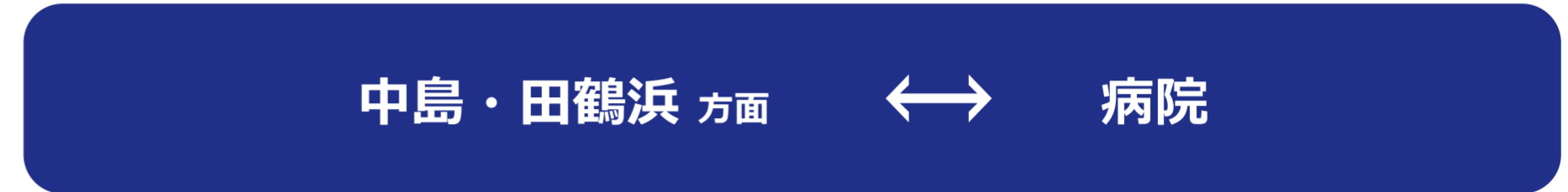
恵寿総合病院 → 田鶴浜・中島方面行き