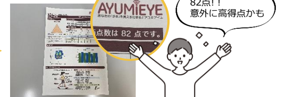
100点満点で結果がわかる！