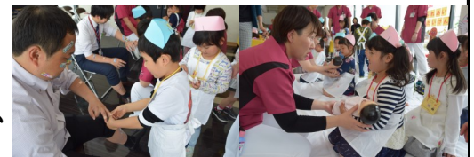
プチナースふれあい看護体験中の園児

は、お話しロボット“パルロ君”の登場で、園児たちは大喜び。パルロの話す言葉を静かに聞き、園児たちと旗揚げゲームで遊びました。