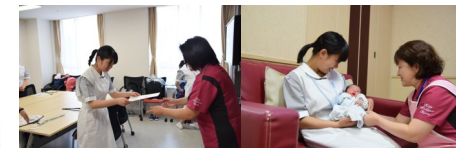
ふれあい看護師体験中の高校生

5月20日(土)は、石川県内の加賀地区、能登地区から高校生6名が、1日看護体験をしました。看護師の制服に着替えると緊張した面持ちで、一人ひとりに本橋看護部長より、辞令が手渡されました。看護体験をした産科病棟では、助産師とともに、超音波装置を使用した子宮内胎児の様子や大きさの観察を体験しました。午後からは、新生児を抱き、『可愛くて、愛おしい』と。また人形を用いて実際の沐浴を体験しました。『魅力ある仕事』と、感想を述べ、看護体験を終えました。